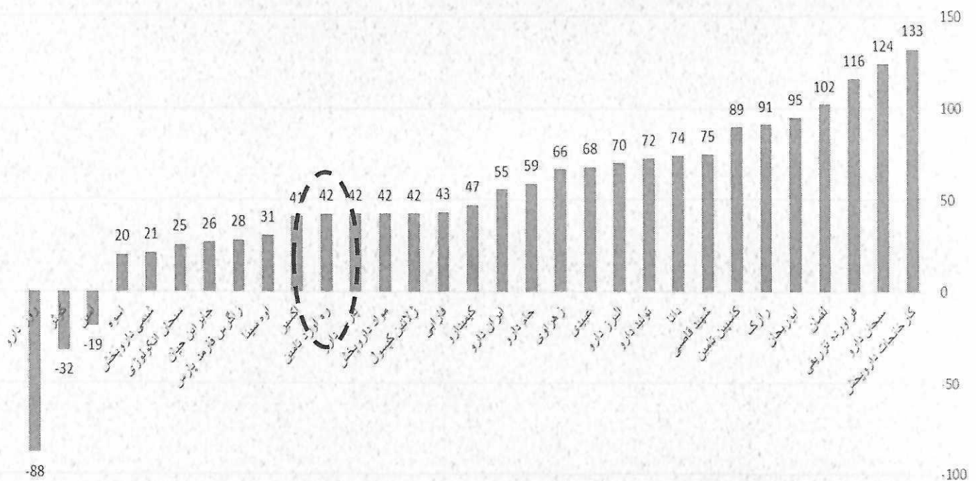
تغییر ارزش فروش تجمیعی نسبت به دوره مشابه سال قبل

مطابق نمودار فوق، شرکت دارویی ره آورد تامین جایگاه هجدهم را در میان شرکتهای دارویی پذیرفته شده در بورس و فرابورس از منظر رشد فروش (۴۲ درصد) به خود اختصاص داده است.